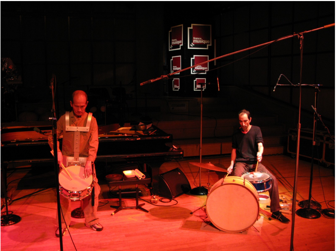
Studio 106 France-Musique 2008

Plus qu'une forme, c'est une énergie à l'œuvre, ignorante, indisciplinée, vibratoire, pourvu seulement que «tout soit rangé à un poil près dans un ordre fulminant.»